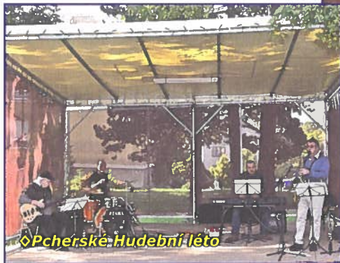
◊Pcherské Hudební léto