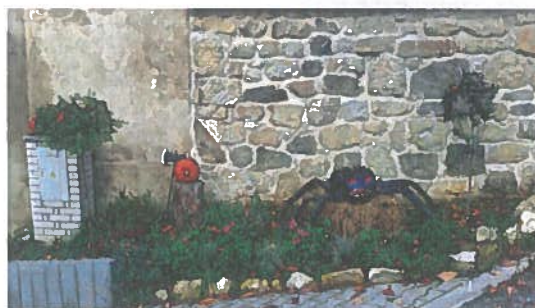
♦Krásně upravené zátiší v ulici U Fary