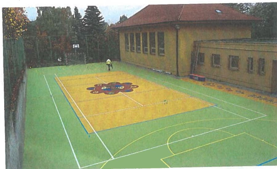
♦ Venkovní hřiště u základní školy prošlo rozsáhlou rekonstrukcí, na kterou se obci podařilo zajistit dotační titul