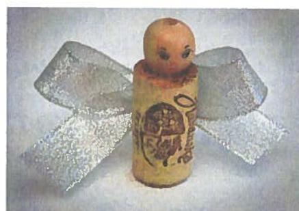
♦Výrobky šikovných pcherských žen se objeví na adventním jarmarku