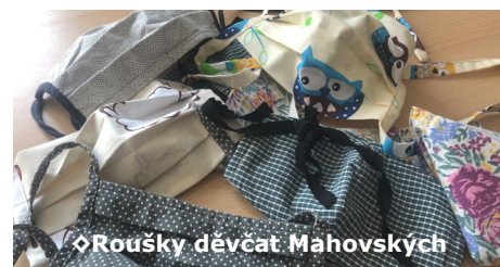
◊ Roušky děvcat Mahovských